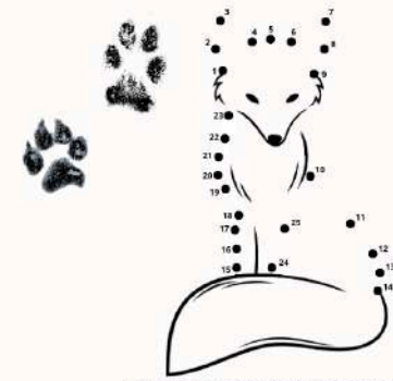
Si tu arrives à tracer une grande croix au centre de l'empreinte sans toucher les coussinets, c'est bel et bien celle d'un renard!