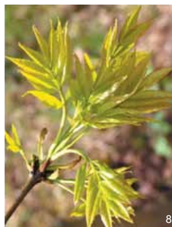
Frêne - Fraxinus excelsior début de feuillaison