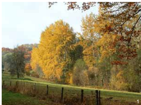
Bordure de champs

Pour chaque station, relevez le type de milieu de la zone : forêt, champs, ville, jardin.