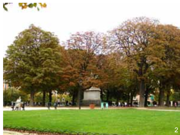
Square de ville

Si vous habitez en zone de montagne, entre 200 et 2200 m d'altitude (Alpes, Pyrénées, Massif Central, Vosges et Jura), nous vous conseillons de vous inscrire à Phénoclim. Vous trouverez des espèces plus adaptées à votre altitude.