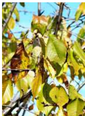
Cerisier - Prunus avium milieu de sénescence