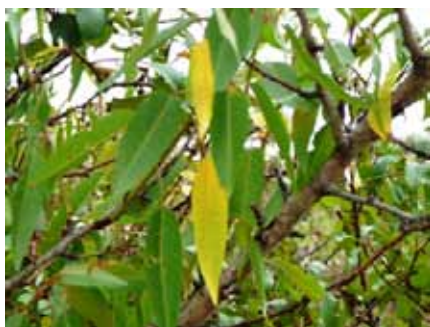
Amandier - Prunus dulcis début de sénescence

Attention ! « changé de couleurs » veut dire que la feuille a perdu son vert d'origine mais elle n'est pas forcément déjà bien jaune ou bien rouge :