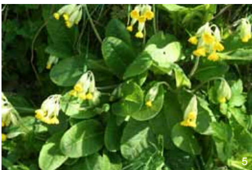
Primevère - Primula veris

Les observations sont très simples à réaliser, c'est pourquoi il n'y a pas de planche des événements phénologiques pour ces espèces. Pour les plantes herbacées, vous devez observer la floraison et noter la date à laquelle la première fleur épanouie a été vue au sein de votre station. Pour les animaux (oiseaux et insectes), il faut noter la date à laquelle l'animal a été vu pour la première fois sur votre station.