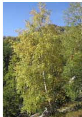
Bouleau - Betula pendula milieu de sénescence

Effectuez au moins un passage par semaine devant vos plantes. Pensez à vous doter des fiches d'identification des espèces animales et végétale disponible sur le site Internet.