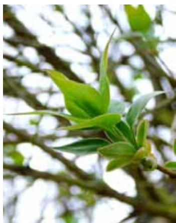
Lilas - Syringa vulgaris début de feuillaison

• Milieu de feuillaison : Notez la date à laquelle 50% des feuilles sont épanouies