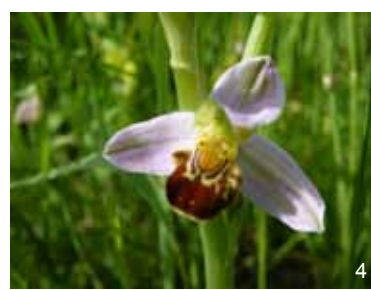
Ophrys abeille - Ophrys apifera

Il vous faut maintenant apprendre à reconnaître les évènements que vous allez observer.