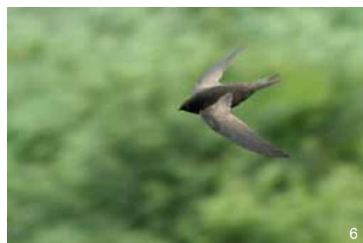
Martinet - Apus apus

Sur le terrain, pensez à vous doter des fiches d'identification des espèces animales et végétales disponibles sur le site Internet.