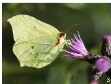
Papillon citron - Gonepteryx rhamni