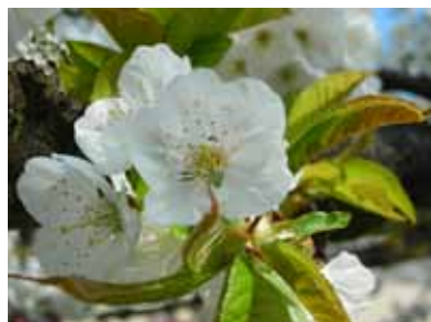
Cerisier - Prunus avium

C'est un peu différent que pour les plantes. Choisissez une zone d'étude d'environ 3 km de diamètre dans laquelle vous avez déjà observé l'espèce. Vous n'aurez plus qu'à noter la date d'apparition (retour de migration, éclosion...) du premier individu de l'espèce choisie.