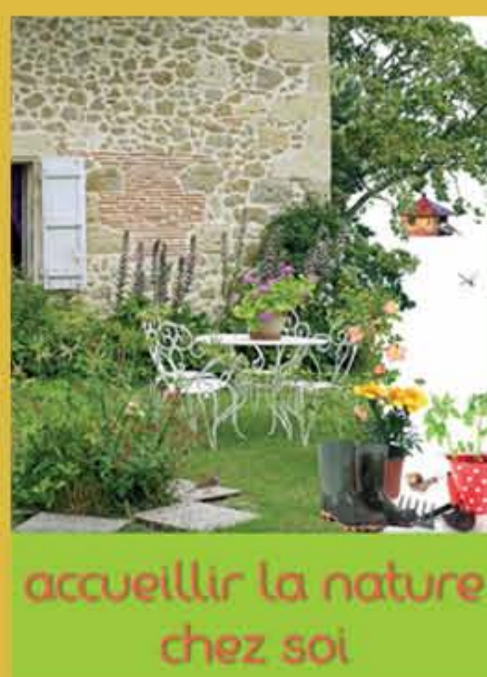
accueillir la nature chez soi

La croissance de la tomate est stimulée par le persil et le basilic. ✿ La sarriette améliore la croissance et le goût des fèves et des haricots. ✿ Le romarin éloigne la mouche de la carotte. ✿ Le concombre, la courge et la citrouille, sont protégés des insectes par la camomille et la marjolaine.